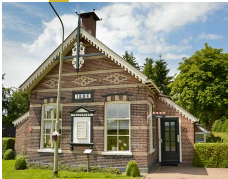
Tolhuis in Foxwolde.

U komt langs een oud tolhuis. Een bord op de gevel maakt duidelijk wat mensen vroeger verschuldigd waren voor het gebruik van de weg.