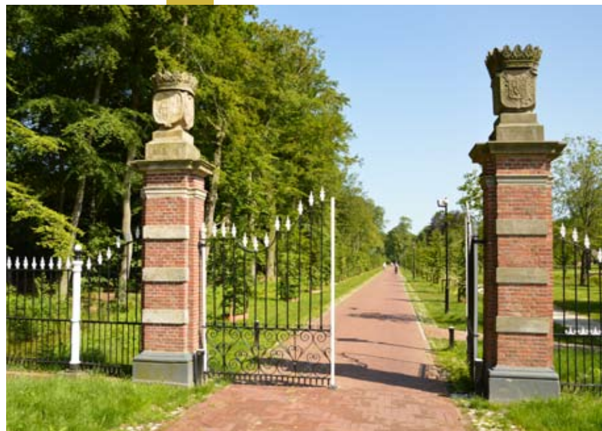
Oprijlaan van Landgoed Nienoord.

Aan het eind van het voetpad ziet u de monumentale toegangspoort van landgoed Nienoord.