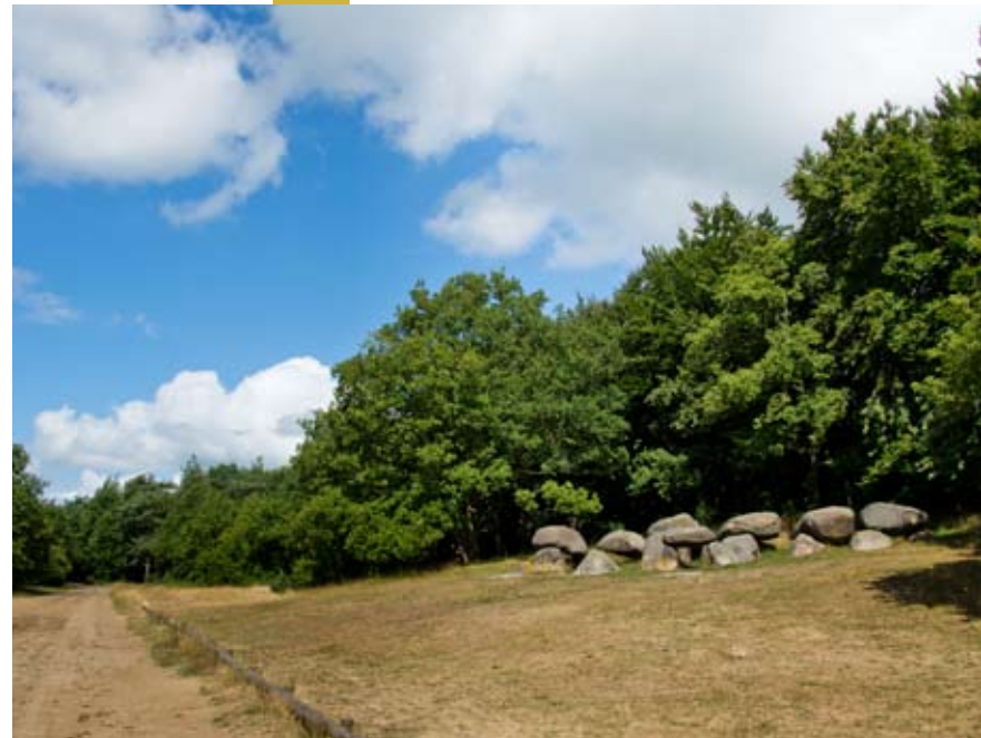
Hunebed D1 in Steenbergen.