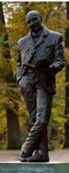
Standbeeld van Hindericus Scheepstra.