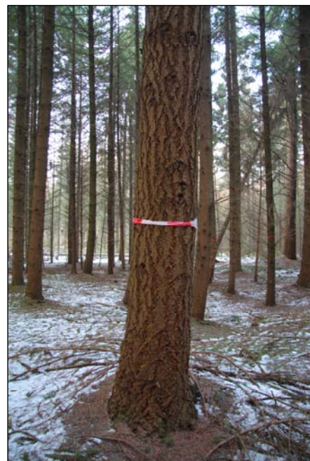
Wijze van markering, rood-wit lint.

De beheerder zorgt ervoor dat de aannemer weet waar zich de flora- en fauna elementen bevinden die bij het uitvoeren van de werkzaamheden moeten worden gespaard en/of ontzien, door het intekenen van de locaties daarvan op een voldoende duidelijke kaart of door aanwijzing en markering in het terrein. Dassenburchten worden altijd in het terrein gemarkeerd. Een en ander wordt vastgelegd in de Checklist bosbeheer.