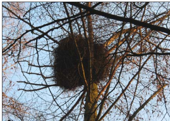
Horst in Larix

Checklist bosbeheer: De Checklist bosbeheer (zie achter deze Gedragscode). Voor zover gebruik wordt gemaakt van een kaart waarop te beschermen elementen worden aangeduid, wordt deze kaart geacht deel uit te maken van de Checklist bosbeheer.