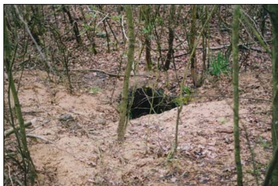
Dassenburchten zijn vaak goed herkenbaar aan hoeveelheid uitgeworpen zand.

De velrichting wordt daarbij altijd van de burcht afgewend. Voor de ingangen mogen geen velhout, takken, toppen of afkortstukken achterblijven.