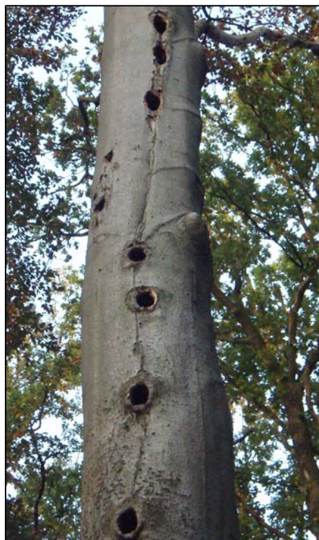
Bomen met holten van specht zijn jaarrond beschermd

Bij de werkzaamheden worden niet alleen de flora- en fauna-elementen die zijn vastgelegd in